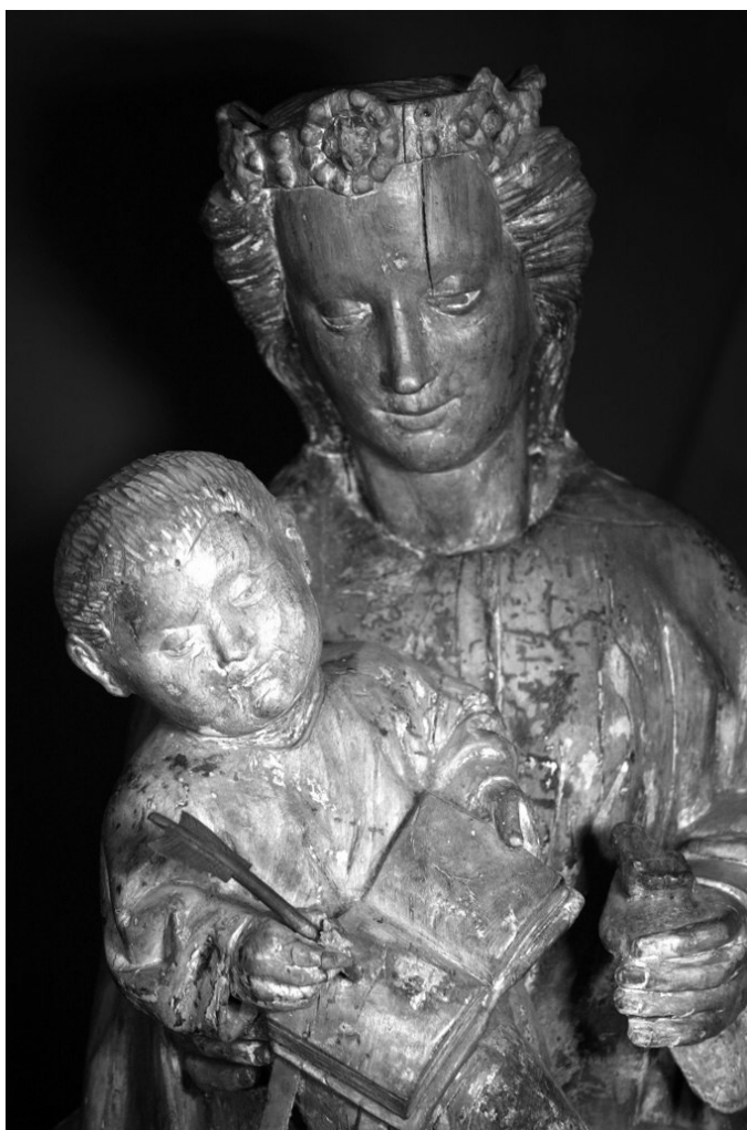
Vierge à l'encrier (XVe siècle)

Et l'avenir n'est pas rose en raison des centres d'intérêt actuels du public. On peut difficilement prévoir le succès d'une exposition, on peut parfois miser sur un mauvais numéro... Tout ceci explique les nombreux appels que nous sommes obligés de lancer, notamment par notre périodique Bloc-Notes , pour y arriver.