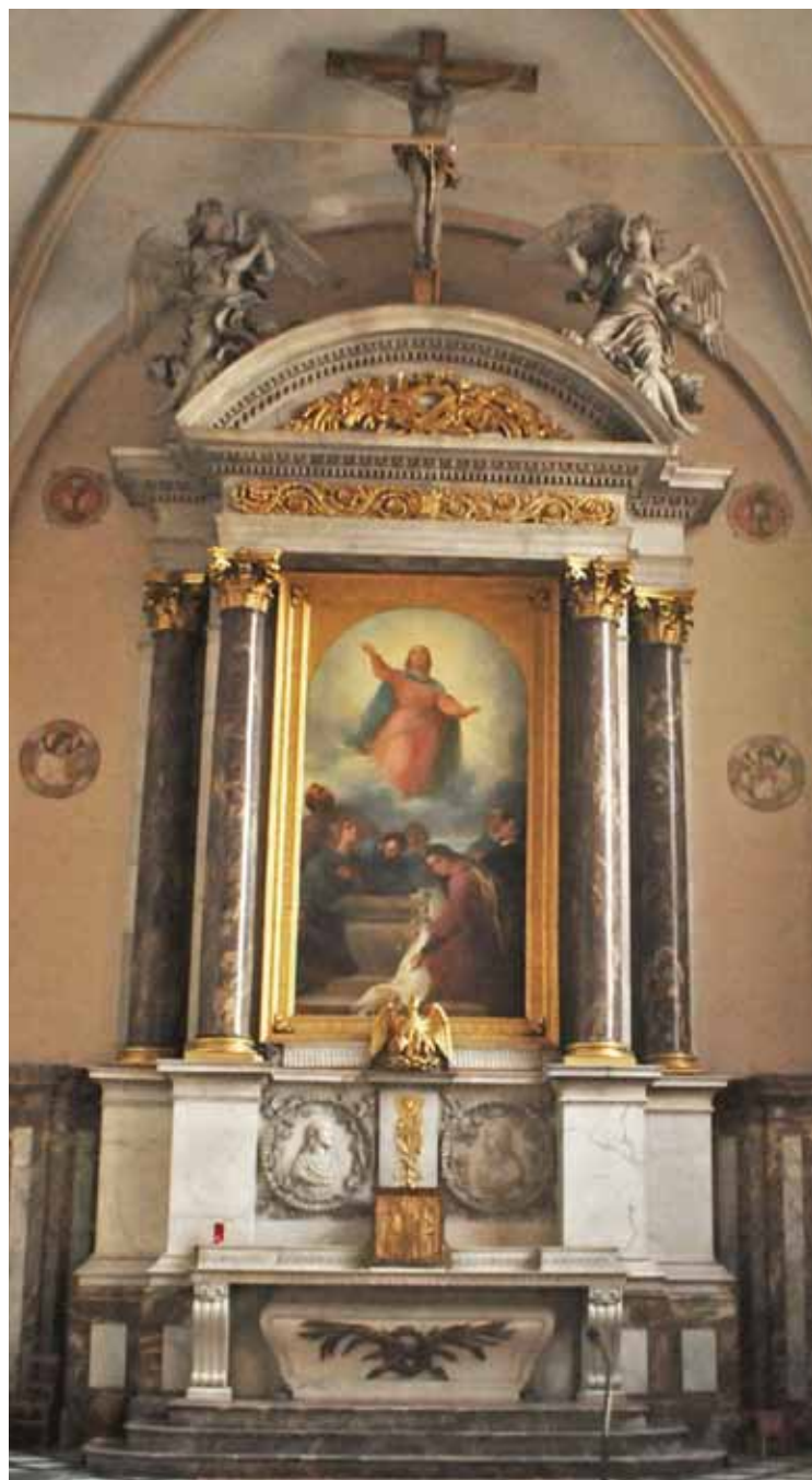
Figure 3. Maître-autel de l'église Notre-Dame de l'Assomption à Seraing.