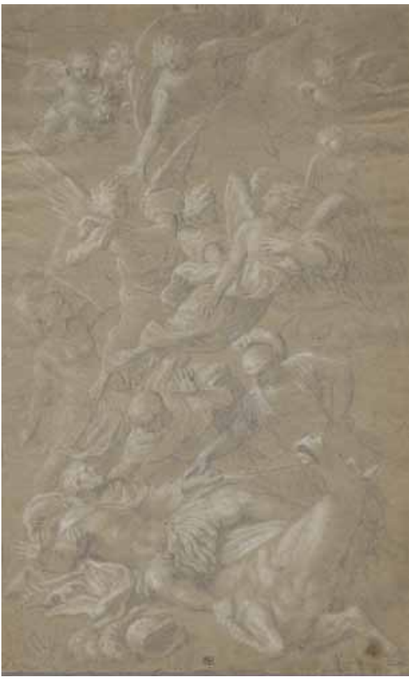
Figure 6. Bertholet Flémal, Conversion de saint Paul , dessin, 42 x 26 cm, Liège, cabinet des Estampes et des Dessins, inv. KD 245/2.