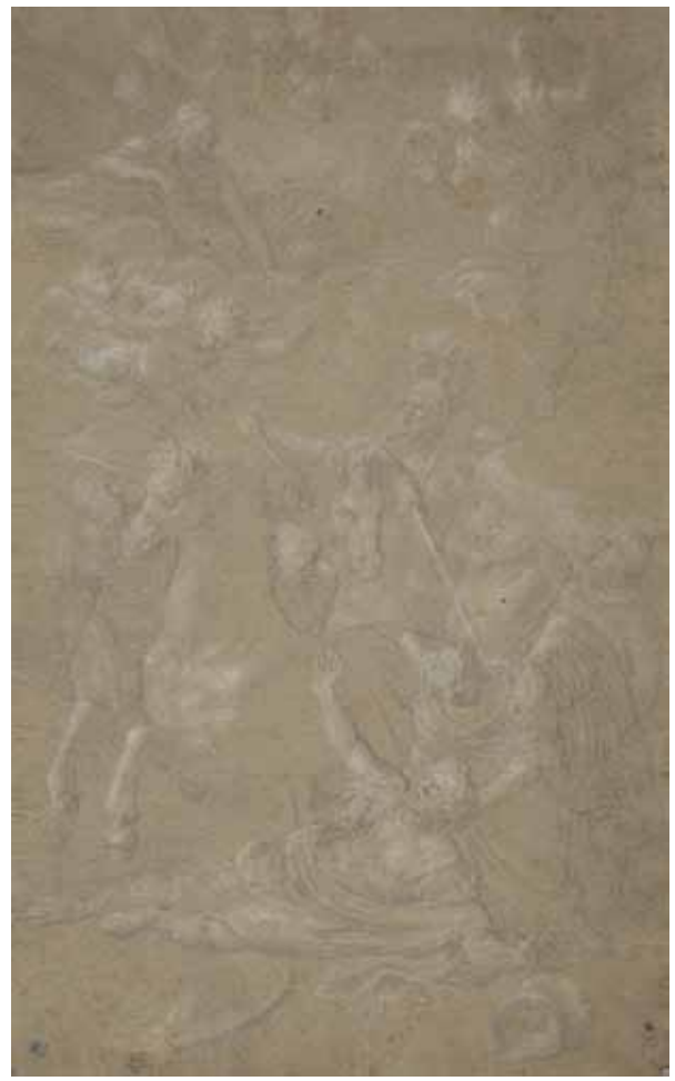
Figure 7. Bertholet Flémal, Conversion de saint Paul , dessin, 42 x 26 cm, Liège, cabinet des Estampes et des Dessins, inv. KD 245/3.