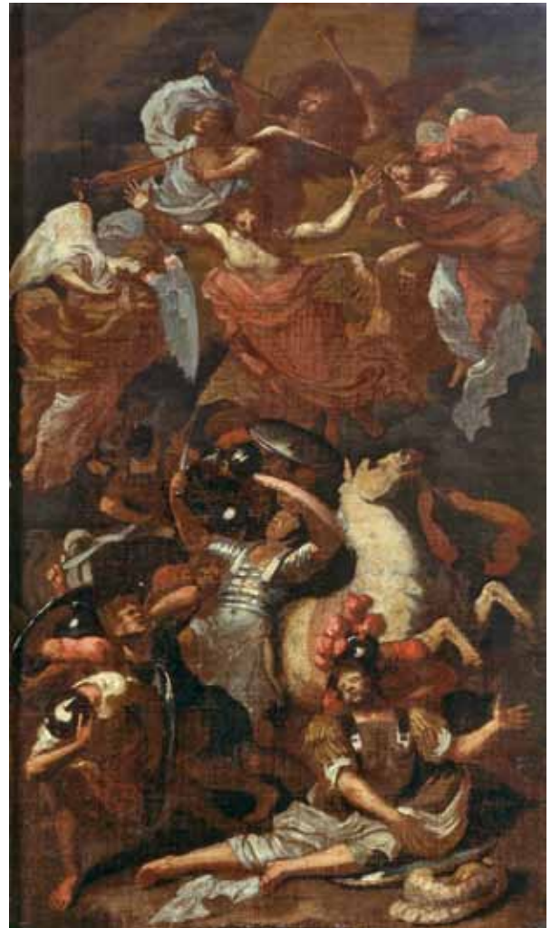
Figure 9. Bertholet Flémal, Conversion de saint Paul , toile, 59 x 35 cm, Liège, musée de l'Art wallon, inv. 6.