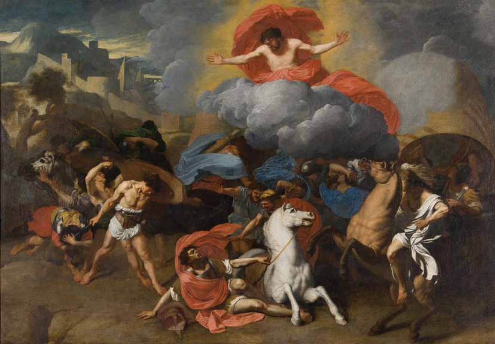
Figure 5. Bertholet Flémal, Conversion de saint Paul , toile, 127 x 185 cm, Liège, Trésor de la cathédrale.

Comme souvent à la fin de sa carrière, il traite son sujet pratiquement sans profondeur, sur un fond opaque très foncé. Ce qui renforce l'effet de cohue. Le contraste devait être accusé, vu la situation de l'autel de Saint-Paul devant les grandes verrières Renaissance du chœur. C'est le genre de sujet qui devait ravir Flémal, car il lui donnait l'occasion d'exprimer les effets de confusion et de désarroi qui lui étaient chers, ainsi qu'il l'a montré dans de nombreuses compositions. Il avait d'ailleurs déjà traité le sujet dans un tableau de cabinet qui doit remonter au milieu des années 1650 (figure 5) 20 . Contrairement à ce dernier tableau, celui destiné au maître-autel de la collégiale Saint-Paul a évidemment été conçu en hauteur, dans un espace très contraint et sans mise en contexte. L'impression est très diffé-