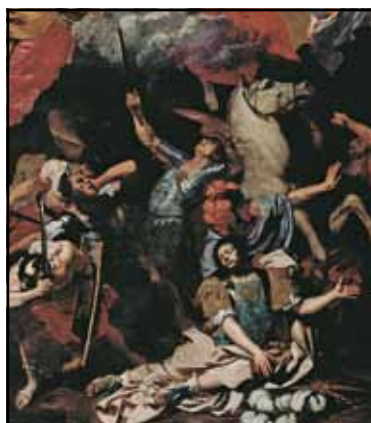
Illustration de couverture :

Conversion de saint Paul (détail), Bertholet Flémal, huile sur toile, vers 1670. Toulouse, musée des Augustins, inv. 2004 1 65.