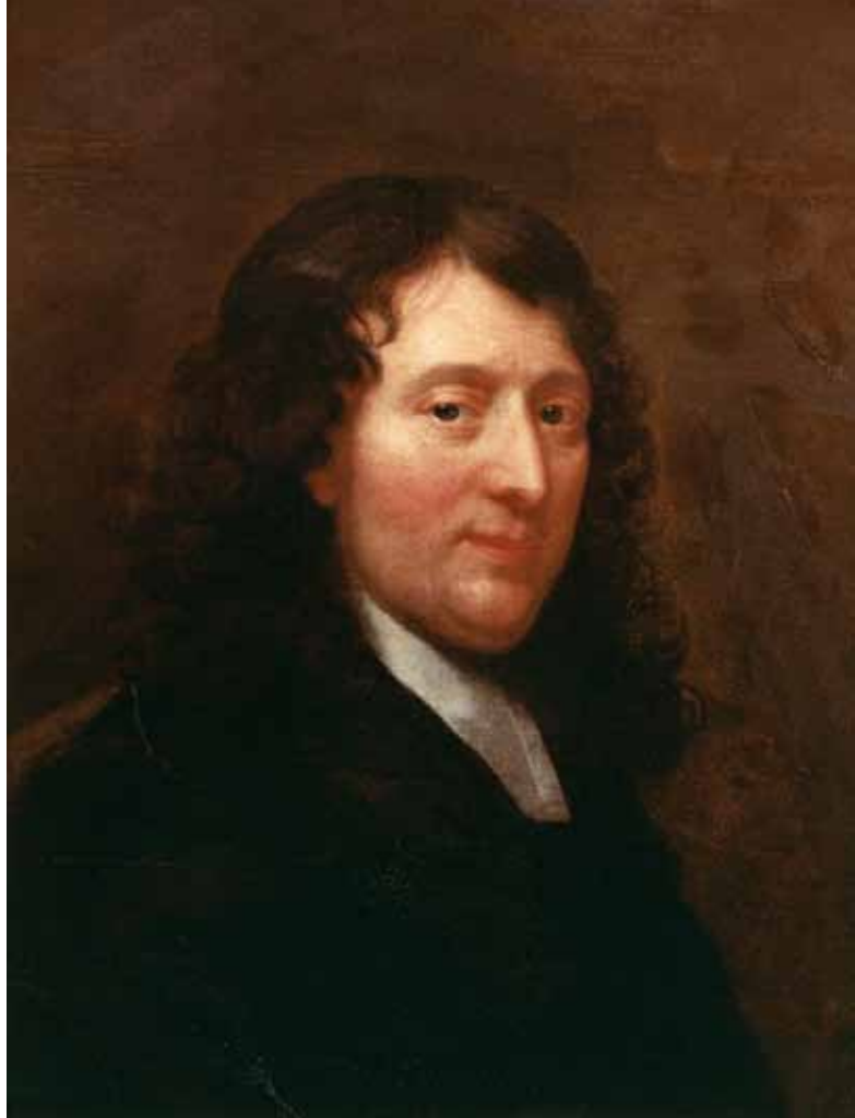
Figure 2. Bertholet Flémal, Autoportrait , toile, 63 x 50 cm, Liège, musée de l'Art wallon, inv. 45.

Pour l'autel de Saint-Paul, nous disposons d'un document précieux : le contrat de commande passé le 26 février 1664 entre le chapitre et les sculpteurs Guillaume Cocquelé et Henri le Mignon 7 . Ce contrat est signé au domicile d'un des chanoines en présence de Bertholet Flémal, qualifié de « maistre pintre et architecte ». Les deux sculpteurs s'engagent, contre la somme de 5000 florins de Brabant, à dresser un maître-autel en marbre d'Italie (à savoir du marbre blanc de Carrare, « le plus beau qui se pourrat trouvé ») avec quatre colonnes en jaspe et des bases et chapiteaux en pierre d'Aix-la-Chapelle ou d'Avesnes. Il sera d'ordre corinthien avec un tabernacle d'ordre ionique. Il devra respecter le modèle dessiné par Flémal et qui a été transcrit dans deux petites maquettes en bois.