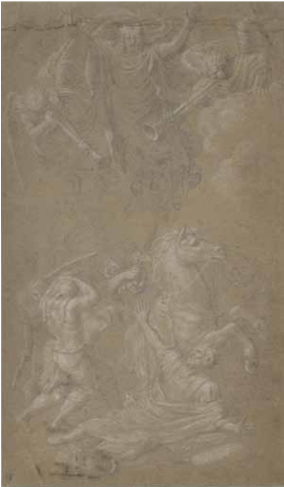
Figure 8. Bertholet Flémal, Conversion de saint Paul , dessin, 41,5 x 25 cm, Liège, cabinet des Estampes et des Dessins, inv. KD 245/1.