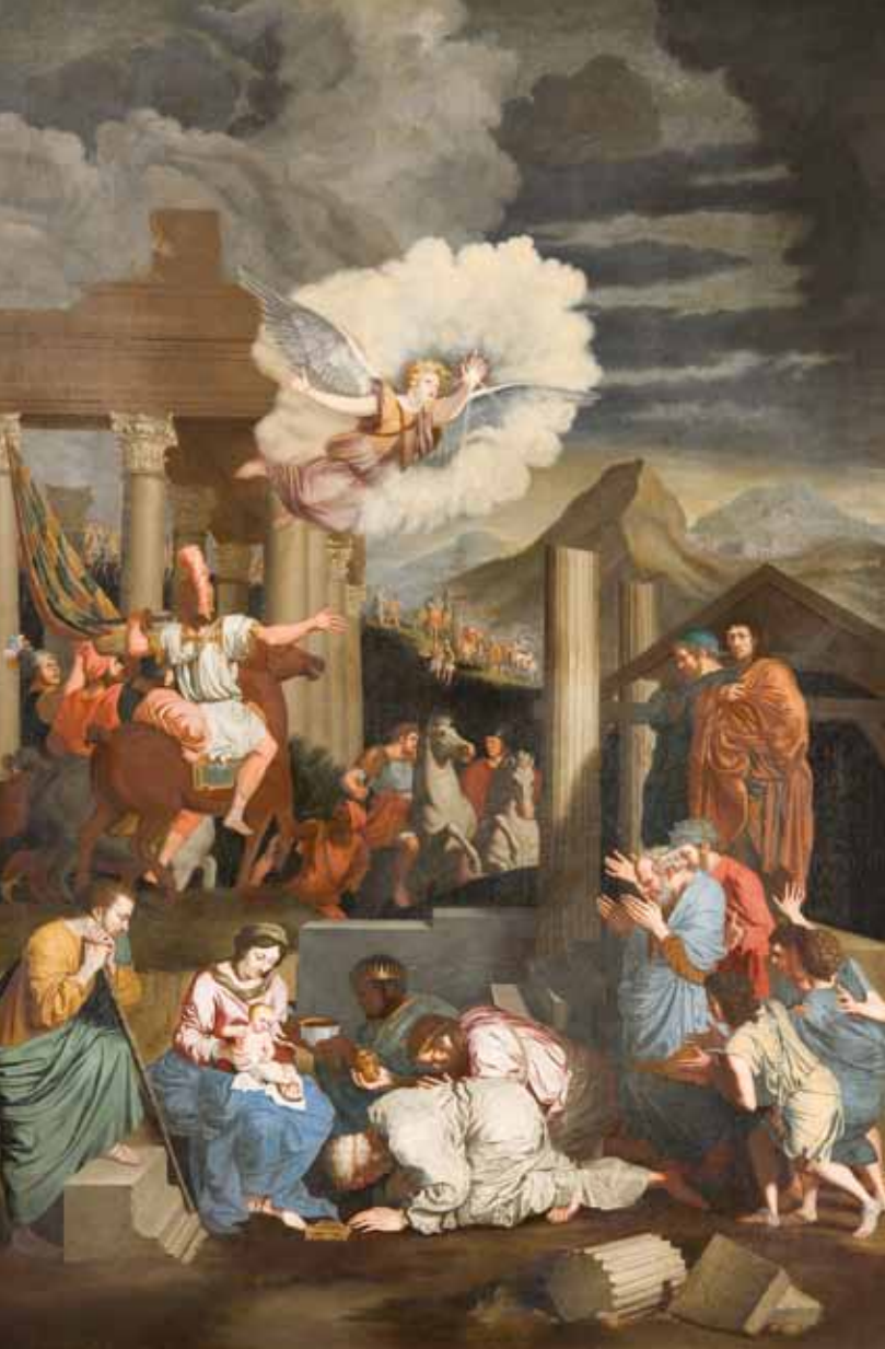
Figure 1. Bertholet Flémal, Adoration des Mages , toile, 171 x 116 cm, Liège, Trésor de la cathédrale.

Jean Valdor le Jeune. Son compatriote l'a en effet employé, avec bien d'autres artistes, à sa grande entreprise : la préparation des Triumphes de Louis le Juste , important volume à la gloire du défunt Louis XIII. Flémal a manifestement dessiné plusieurs compositions allégoriques destinées à être traduites en gravures pour ce recueil qui est sorti de presse en 1649. C'est sans doute Valdor, bien implanté à la cour, qui en ce milieu des années 1640 introduisit Flémal dans les milieux aristocratiques de la capitale. C'est peut-être grâce à cette entremise que le peintre a obtenu une commande capitale : la peinture de la coupole de l'église Saint-Joseph des carmes, pour laquelle il a collaboré avec son compatriote et futur rival Walthère Damery. Flémal s'est produit sur un autre important chantier